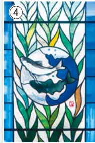
④工房内には、シンボルである「あゆ」がデザインされたステンドグラスが輝く

◆(福)なごみ福祉会 多摩川あゆ工房 川崎市多摩区中野島4-3-28 ☎044-911-1315 FAX044-911-0462 URL http://www.nagomi-fukushi.or.jp/ayu-kobo/