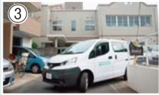
③あゆ工房外観と現場に向かう車両