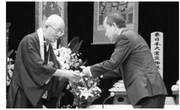
天台宗神奈川教区溝江光運宗務所長(左)より、ともしび基金への寄附目録を受領

本紙6月号12面(かながわHOT情報)で、湘南ロボケアセンターで実施する介護保険事業を「訪問介護」と記載しましたが、正しくは「訪問看護」でした。関係者の方々にご迷惑をお掛けしたことをお詫びし、訂正いたします。