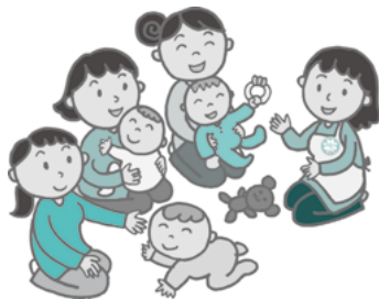
子育てサロンに参加した保護者が「いつもと違う様子だな」「心配事があるのかな」等の視点を持ちつつ見守ります。

このように、子どもや子育て世帯が笑顔で生活を送れることができるよう、また、子育てを