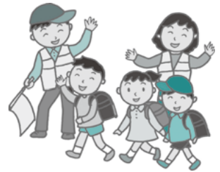
登下校時のあいさつ運動をとおして、子どもと顔見知りの関係をつくり、声を掛けられやすい関係を築きます