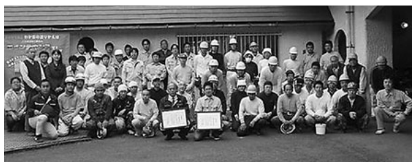
神奈川昭和会、日本塗装工業会県支部では10月18日に、第30回塗装ボランティア活動を児童福祉施設にて実施しました

〈寄附物品〉神奈川県石油商業組合、神奈川県石油協同組合、西区子ども会育成連絡協議会、神奈川県定年問題研究会、神奈川昭会、日本塗装工業会県支部