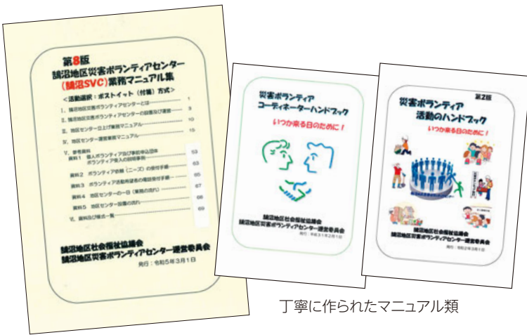
丁寧に作られたマニュアル類