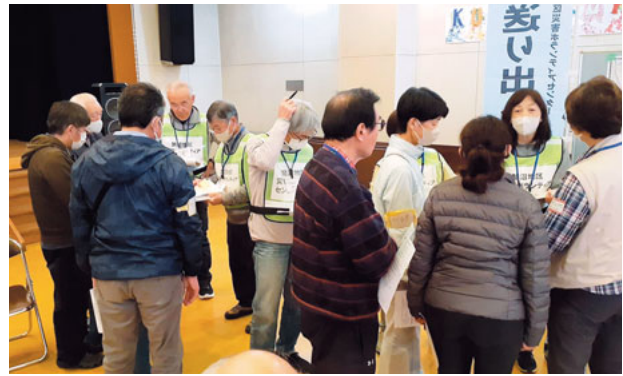
災害ボランティアセンター設置運営訓練のようす