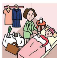
仕事と病気の子どもの看病 でほかに何もできない