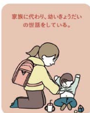
家族に代わり、幼い子ども の世話をしている。