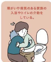
障がいや病気のある家族の 入浴やトイレの介助を している。