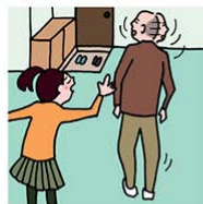
目を離せない家族の見守り などのケアをしている