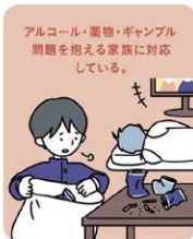
アルコール・薬物・ギャンブル の問題を抱える家族に対応 している。