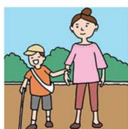
障害のあるこどもの子育て・ 障害のある人の介護をしている

©一般社団法人日本カアラ連盟 / illustration: Izumi Shiga