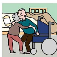
健康不安を抱えながら高齢 者が高齢者をケアしている