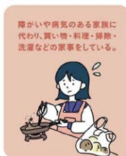
障がいや病気のある家族に 代わり、買い物・料理・掃除・ 洗濯などの家事をしている。

本来大人が担うと想定されている家事や家族の世話など日常的に行っていることも・若者のこと