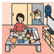
アルコール・薬物・ギャンブル を抱える家族に対応している