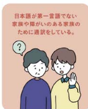
日本語が第一言語でない 家族や障がいのある家族の ために通訳をしている。