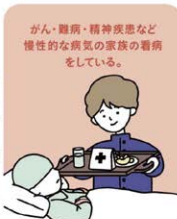
がん・難病・精神疾患など 慢性的な病気の家族の看病 をしている。