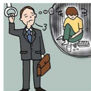
障害や病気の家族の世話や 介護をいつも気にかけている

こころやからだに不調のある人への「介護」「看病」「療育」「世話」「気づかい」など、 ケアの必要な家族や近親者・友人・知人などを無償でケアする人たちのことです。