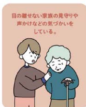
目を離せない家族の見守りや 声かけなどの気づかいを している。