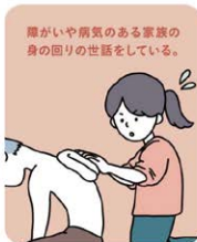
障がいや病気のある家族の 身の回りの世話をしている。