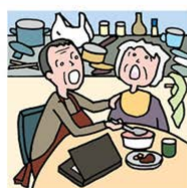
仕事を辞めてひとりで親の 介護をしている