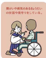
障がいや病気のあるきょうだい の世話や見守りをしている。