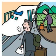
遠くに住む高齢の親が心配 で頻繁に通っている