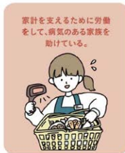
家計を支えるために労働 をして、病気のある家族を 助けている。